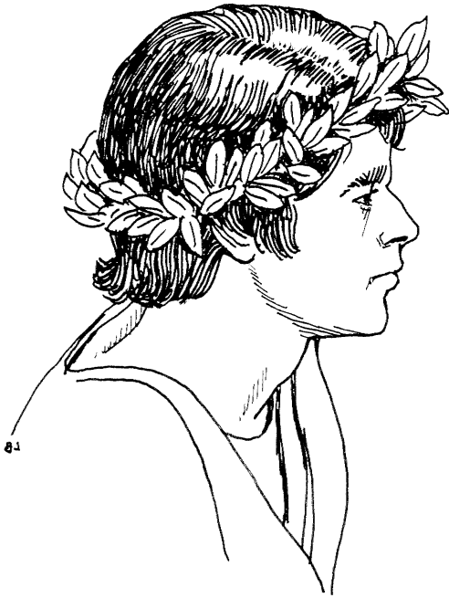
Bing gõnu pólông anũn kiäng kơ dũn mã tũ quang muk... (1 Korinthos 9:25)

tơlơi juất anũn yơh. 21 Tơdang kào hròm hăng bing bu dồ gah yũ tơlơi juất, kào jing kar hăng mơnuih bu dồ gah yũ tơlơi juất ôh, wốt tởdah kào bu rơngai ôh mớng tơlơi juất Oĩ Adai samở kào dồ gah yũ tơlơi juất Krist, kào ngã tui anũn kiäng kơ ba glai bing bu dồ gah yũ tơlơi juất anũn. 22 Tởdang kào hròm hăng bing hơmào tơlơi đảo tởdu amăng tơlơi đảo kơnang, kào ăt jing kar hăng tởdu mơn kiäng kơ ba glai bing tởdu anũn. Tui anũn, kào jing djởp mơta tơlơi kơ djởp djuai mơnuih kiäng kơ yua mớng tơlơi kào jing anũn kào dũn pơklaih hĩ đởđả amăng bing gõnu. 23 Kào ngã abih bang tơlơi anũn yuakơ tơlơi pơthào hiam kiäng kơ dũn pơpha hròm bing gõnu amăng tơlơi bơni hiam anũn.