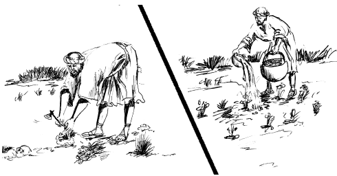
...samở Ơi Adai yơh jing Pô ngả bơi kơ ớđo đẩ... (1 Korinθος 3:6)

5 Tui anủn, hợi Apollos jing lế? Lai hợn pơkỏn Paul jing lế? Bing gớmới kớnhởng jing bing đing kớna Ơi Adai đờc, jing yua mớng bing gớmới yơh bing gih đảo kớnang, jing Khua Yang yơh hơmào jao bơi lai kơ rĩm ớđo brũa mớnuả ñu anủn. 6 Kào pla lai pơjẻh, Apollos pruih lai ia, samở Ơi Adai yơh jing Pô ngả bơi kơ ớđo đẩ. n 7 Tui anủn, pơ pla hăng pơ pruih ia bu yom ôh, samở kớnhởng hợjăn Ơi Adai đờc yơh, jing Pô ngả bơi kơ gớnam tằm ớđo đẩ. 8 Pô pla hăng pơ pruih ia jing bing hơmào