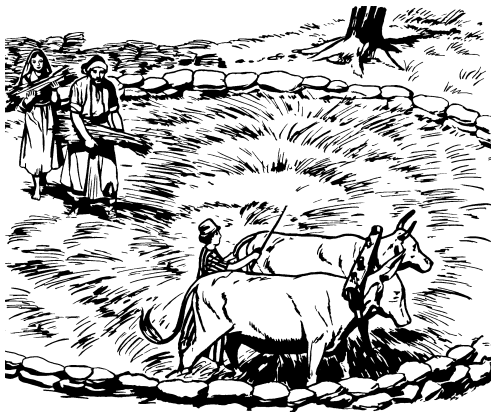
“Anãm troả tởbỏng rỏmỏ tởno tởdang ñu kuả pỏdai òh.” (1 Korinθος 9:9)

7 Hỏi pỏ ngỏ tởhan lai hỏnữn bởng prãk ñu pỏ lẻ? Hỏi pỏ pla phũn boh kỏbào lai hỏnữn bu bởng đở òh boh kỏbào anũn lẻ? Hỏi pỏ rong triu lai hỏnữn bu yua ia tởsỏo triu anũn òh lẻ? 8 Kào bu lai tui hãng tởlời mớnuh mớnam juắt lai òh, samỏ Tởlời Juắt ất lai kar kỏi mỏn. 9 Yuakơ Tởlời Juắt Mỏse hỏmáo cỉh lai hỏnữn anai, “Anãm troả tởbỏng rỏmỏ tởno tởdang ñu kuả pỏdai òh.” Đở mỏ Oỉ Adai pỏmĩn bởng bởi kơ rỏmỏ anũn? 10 Sít yõh ñu lai tui anũn yuakơ tởlời tú yua ta, đở mỏ? Sít yõh, tởlời anũn Mỏse cỉh bởi kơ bing ta, yuakơ tởdang pỏ kai hỏma hãng hỏpuả pỏdai mã bruả, bing gỏnữ ngỏ tui anũn cang rỏmang kiãng kơ pỏpha hrỏm amãng tởlời hỏpuả yõh. 11 Tỏdah bing gỏmỏi sai pỏjẻh gah bởngãt amãng bing gih, hiữm ngỏ lu đỏi hã tỏdah bing gỏmỏi hỏpuả gỏnam yua