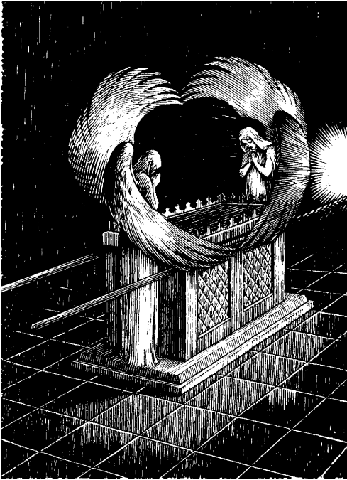
...Hip Tơlơi Pơgop klôp hăng mah... (Hêbrơ 9:4)

boh rup çerub pơala kơ tơlơi Oĩ Adai dỏ pơ anũn, hơmào khul čăng gơnu gòm hĩ kơnỏp Hip jing anih pơh pơkra tơlơi pap bơi tơlơi soh. Samở bing ta bu dủi pơblang kơ tơlơi anũn djỏp djel ôh rả anai. h